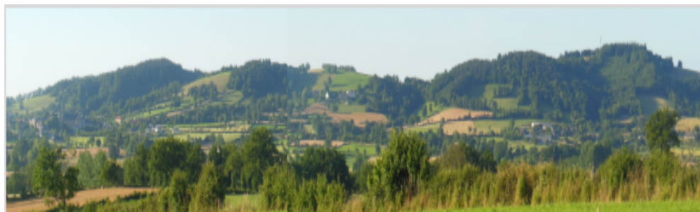
POINT de VUE sur les PUECHS de Bournazel